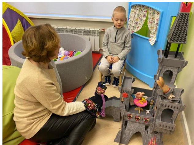
КОНСУЛЬТАЦИЯ И ЗАНЯТИЯ С ПСИХОЛОГОМ